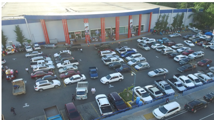
Tienda principal de Ferretería Ochoa