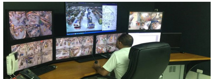
Estacion de monitoreo central de Ferretería Ochoa